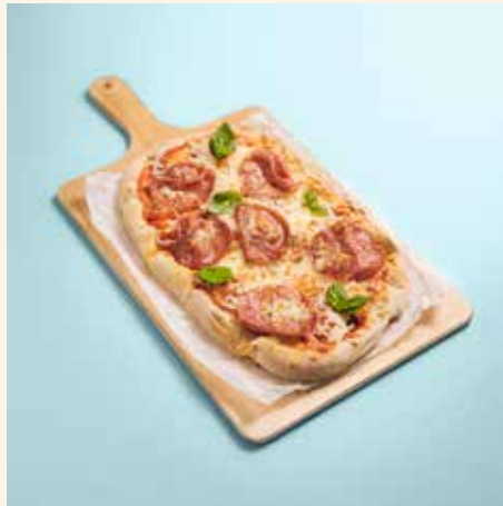
Italian Boss 14,90

Tomatensoße, Mozzarella, Salami, Basilikum A/G tomato sauce, mozzarella, salami, basil