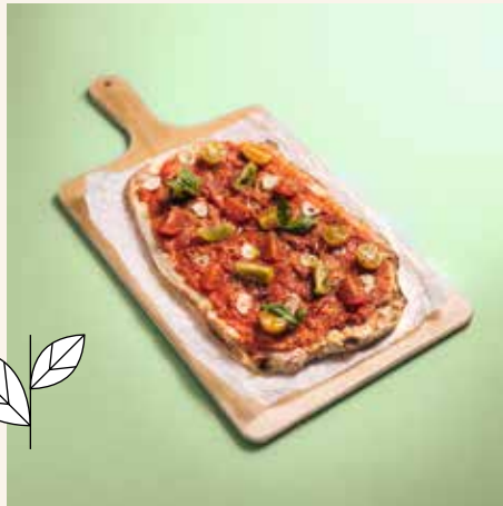
Marinara (vegan) 10,80

Tomatensoße, frische Cocktailtomaten, Oregano, Knoblauch, Basilikum A tomato sauce, fresh cocktail tomatoes, oregano, garlic, basil