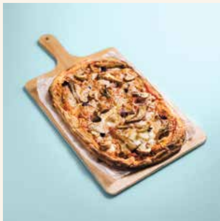
Magic Mushroom 13,90

Tomatensoße, Mozzarella, Pilze A/G tomato sauce, mozzarella, mushrooms