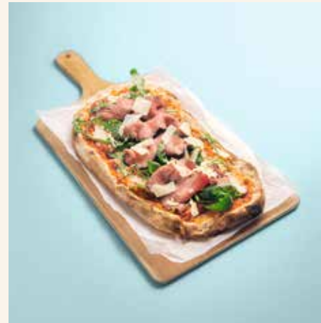
Beef Lover 18,90

Tomatensoße, Mozzarella, Rucola, Roastbeef, Parmesan A/F/M/O tomato sauce, mozzarella, arugula, roastbeef, parmesan cheese