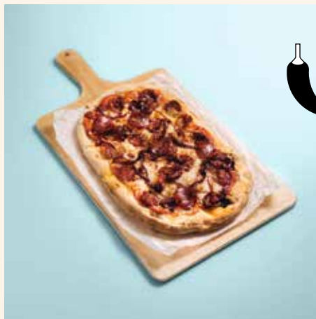
Baby It's Hot Inside 14,90

Salsiccia piccante, karamellierte Zwiebel, Mozzarella, Peperoncini A/G/O salsiccia piccante, caramelized onions, mozzarella, peperoncini