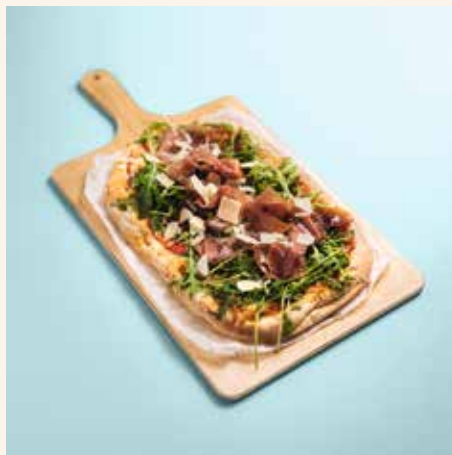
Heart Of Parma 15,50

Tomatensoße, Mozzarella, Rucola, Parmesan, Prosciutto A/G tomato sauce, mozzarella, arugula, parmesan, prosciutto