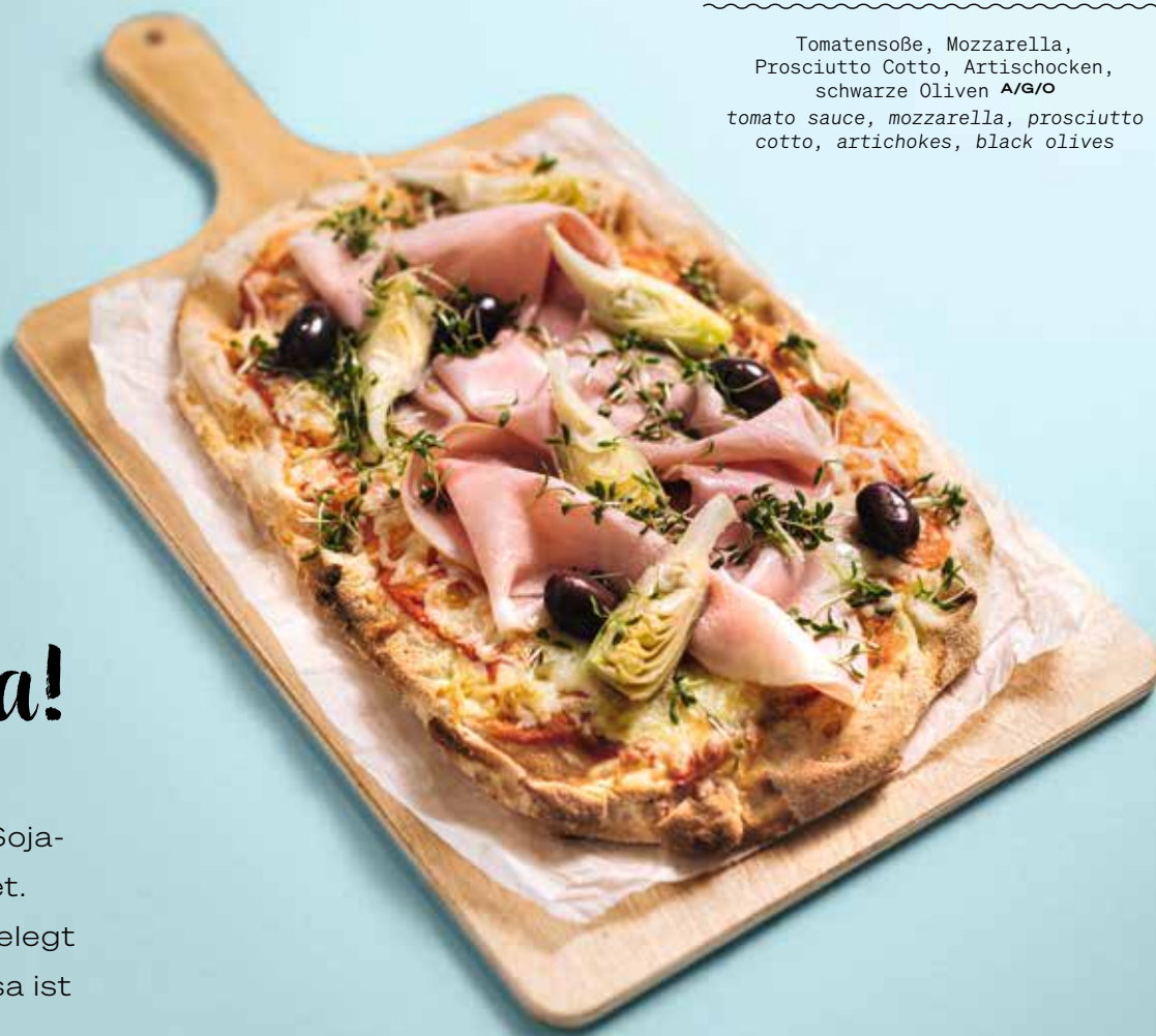
Sun Of Capri 14,90

Der Sauerteig für unsere Pinsa wird aus Weizen-, Soja- und Reismehl gefertigt, bevor er 72 Stunden rastet. Danach wird der Teig mit ausgewählten Zutaten belegt und in unserem speziellen Ofen gebacken. Die Pinsa ist nicht nur geschmacklich unverwechselbar, sie ist besonders knusprig und leicht bekömmlich.